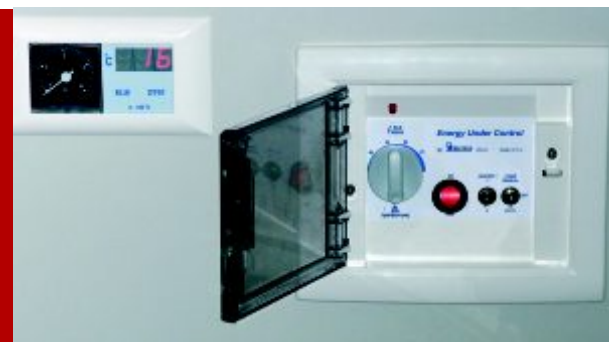
Πίνακας ελέγχου λειτουργιών και όργανα ενδείξεων