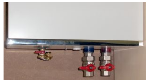
Διάσταση παροχών προσαγωγής και επιστροφής 1"